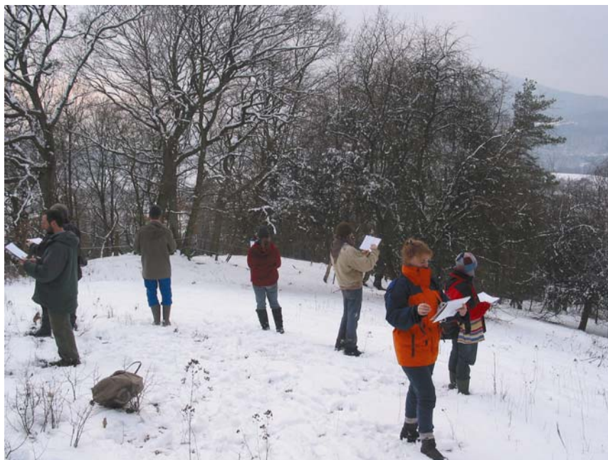
Abb. 2: Mitarbeiter von Gut Hohenberg beim ersten Landschaftsseminar im März 2004

Auf Gut Hohenberg wurde dieser Prozess durch über Landschaftsseminare (Abb. 2) im Rahmen von PETRARCA, der Europäischen Akademie für Landschaftskultur ( www.petrarca.org ), begleitet. Ziel der Seminararbeit, deren Methodik auf Erfahrungen in zahlreichen Seminarveranstaltungen und Kursen beruht (VAN ELSSEN et al. 2003a), ist, die Bewirtschafteter in die Lage zu versetzen, zu verantwortungsbewussten Entscheidungen zu gelangen.