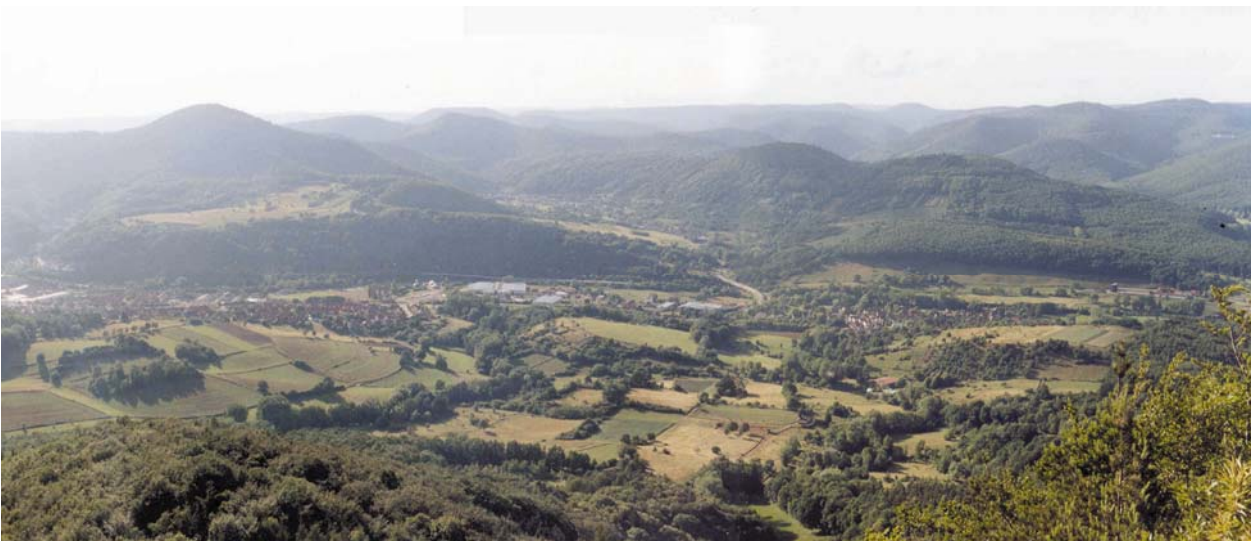
Abb. 1: Blick vom Hohenberg auf die Landschaft von Gut Hohenberg

Der Pfälzerwald (ein Ausschnitt in Abb.1) ist ein Mittelgebirge basenarmer Gesteine. Prägend sind der Buntsandstein, ein mildes Klima, die armen und deshalb waldbedeckten Böden, die geringe Besiedlung und die Schwäche der Wirtschafts- und Infrastruktur. Die Landwirtschaft stand früher in enger Verbindung mit der Waldwirtschaft, die Realteilung hinterließ kleine Strukturen und der Anteil der Nebenerwerbslandwirtschaft war bereits Ende des 19. Jahrhundert sehr hoch. Ab 1960 fand ein gravierender Strukturwandel in der Landwirtschaft statt: Ackerflächen wurden aufgegeben („Vergrünlandung“), die Großviehhaltung ging zurück und somit auch der Bedarf an Grünland. Steile Hänge und Täler fielen zuerst brach; die Landespflege fördert heute die Offenhaltung (vgl. BENDER 1979, GEIGER 1987).