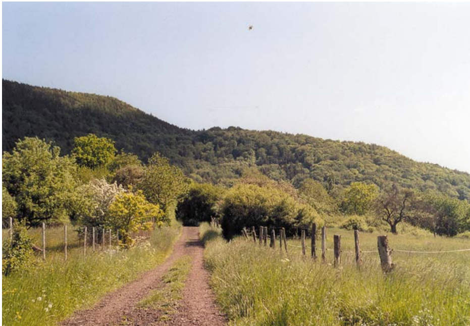
Abb. 4: Saumstrukturen und Übergangszonen

Die Biotoptypen der Hofflächen zeichnen sich vor allem durch ihre extensive Nutzung, den kleinräumigen Wechsel von Standortverhältnissen, den hohen Anteil an Saum- und Übergangszonen (Abb. 4) sowie die geringe Trophie aus. Zudem ist ein Nebeneinander der verschiedenen Sukzessionsstadien typisch, welches auch weiterhin für die Landschaftsentwicklung eine Orientierung bieten kann.